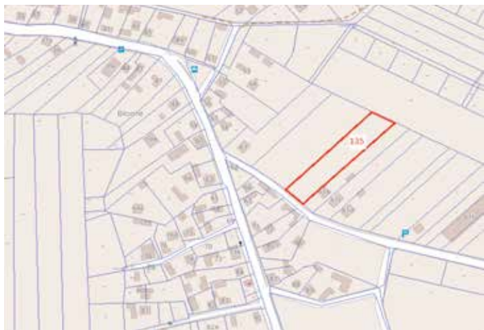
Sokołów Dolny 135