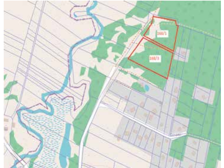
Bizoręda 168/1, 168/3

Ponadto informujemy, że na stronie internetowej www.sobkow.pl w zakładce „Nieruchomości” zamieszczone są informacje dotyczące innych działek przeznaczonych do sprzedaży z zasobu gm. Sobków. Zapraszamy do zapoznania się z ofertą.