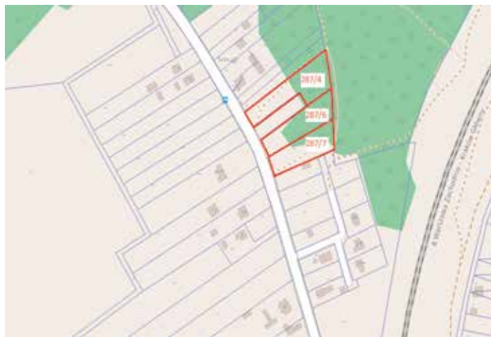
Sokołów Dolny 287/4, 287/6, 287/7