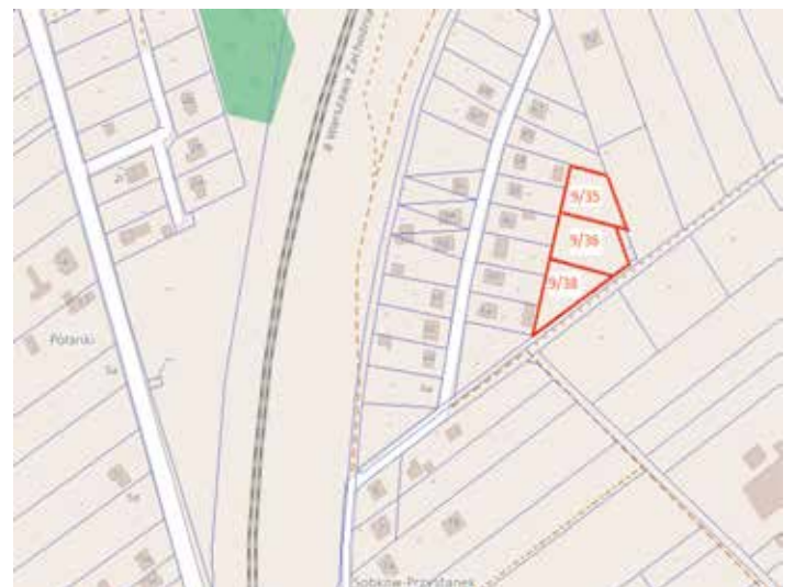
Sokołów Dolny 9/35, 9/36, 9-38