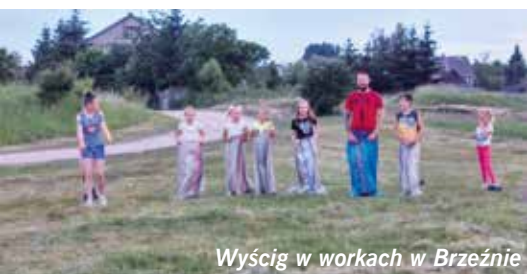
Wyścig w workach w Brzeźnie

W tym dniu w świetlicy wiejskiej w Brzeźnie odbyły się zawody sportowe dzieci i młodzieży. Dla wszystkich chętnych odbył się wyścig w workach, który sprawił wiele radości, a także zawody z hulahop, w których brały udział dziewczęta. W Jaworze po zakończeniu ogniska odbyły się gry i zaba-