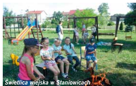
Świetlica wiejska w Staniowicach