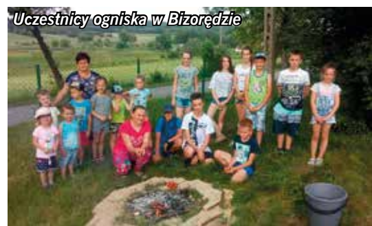
Uczestnicy ogniska w Bizoreździe