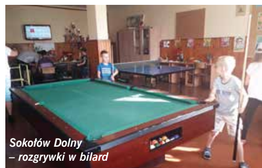
Sokołów Dolny – rozrywki w bilard