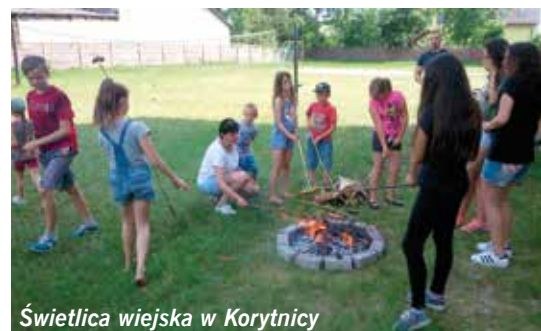
Świetlica wiejska w Korytnicy