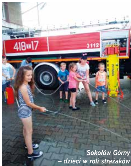
Sokołów Górny – dzieci w roli strażaków

smaku i zapachu różnych produktów spożywczych. W Miąsowej ten szczególny dzień stał się okazją dla dzieci, aby zintegrować się, poodychać świeżym powietrzem, wziąć udział w zajęciach sportowych i luźnej zabawie: chłopcy rozegrali mecz piłki nożnej, dziewczynki grały w badmintona. W Mzurowej w spotkaniu wzięły udział dzieci uczęszczające do szkoły podstawowej, jak również młodsze dzieci. W ramach obchodów tego radosnego święta oprócz udziału w ognisku i słodkim poczęstunku, dzieci miały możliwość wykonania prac plastycznych w plenerze. Pozostały czas upłynął na wspólnych grach i zabawach zręcznościowych. W Sokołowie Dolnym oprócz grilla odbyły się gry sportowe. Zabawy cieszyły się dużym zainteresowaniem, zarówno starszych jak i młodszych dzieci. Tego dnia wszyscy byli wygrani, a na zakończenie każde dziecko otrzymało słodki poczęstunek w postaci cukierków. Strażacy z OSP w Sokołowie Górnym przygotowali dzieciom niespodziankę, otóż zaaranżowali wypadek, aby uczestnicy spotkania mogli wziąć udział w udzielaniu pierwszej pomocy poszkodowanemu. Dzieci również mogły wejść na wóz strażacki i do środka kabiny. Największą frajdę sprawiła im moż-