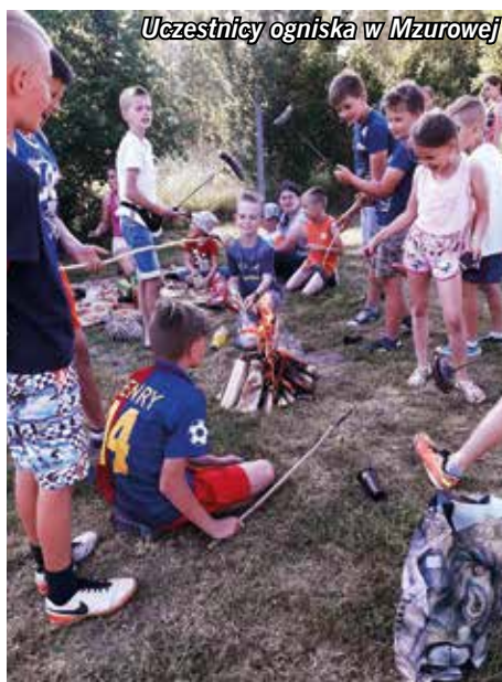
Uczestnicy ogniska w Mzurowej

smaku i zapachu różnych produktów spożywczych. W Miąsowej ten szczególny dzień stał się okazją dla dzieci, aby zintegrować się, poodychać świeżym powietrzem, wziąć udział w zajęciach sportowych i luźnej zabawie: chłopcy rozegrali mecz piłki nożnej, dziewczynki grały w badmintona. W Mzurowej w spotkaniu wzięły udział dzieci uczęszczające do szkoły podstawowej, jak również młodsze dzieci. W ramach obchodów tego radosnego święta oprócz udziału w ognisku i słodkim poczęstunku, dzieci miały możliwość wykonania prac plastycznych w plenerze. Pozostały czas upłynął na wspólnych grach i zabawach zręcznościowych. W Sokołowie Dolnym oprócz grilla odbyły się gry sportowe. Zabawy cieszyły się dużym zainteresowaniem, zarówno starszych jak i młodszych dzieci. Tego dnia wszyscy byli wygrani, a na zakończenie każde dziecko otrzymało słodki poczęstunek w postaci cukierków. Strażacy z OSP w Sokołowie Górnym przygotowali dzieciom niespodziankę, otóż zaaranżowali wypadek, aby uczestnicy spotkania mogli wziąć udział w udzielaniu pierwszej pomocy poszkodowanemu. Dzieci również mogły wejść na wóz strażacki i do środka kabiny. Największą frajdę sprawiła im moż-