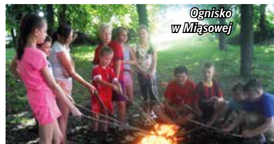
Ognisko w Miąsowej

liwość lania wodą tak, jak przy prawdziwym pożarze. Natomiast w sobotę 2.06.2018 r. dla dzieci zorganizowana została dyskoteka, na której odbywało się malowanie twarzy oraz przygotowano słodki poczęstunek. Na czas świętowania Dnia Dziecka dołożono wszelkich starań, żeby dzieci w świetlicach wiejskich przeżyły ten dzień interesująco i wyjątkowo, dobry humor je nie opuszczał, a po wspólnych spotkaniach pozostały miłe wspomnienia.