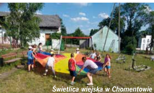
Świetlica wiejska w Chomentowie

wy na placu świetlicy. w Starych Kotlicach z okazji Dnia Dziecka, podobnie jak w pozostałych świetlicach, odbyło się ognisko z pieczeniem kiełbasek, a następnie gry i konkursy na boisku oraz zabawy w świetlicy m.in. poznawanie (z zamkniętymi oczami)