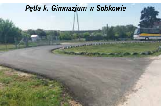
Pętla k. Gimnazjum w Sobkowie