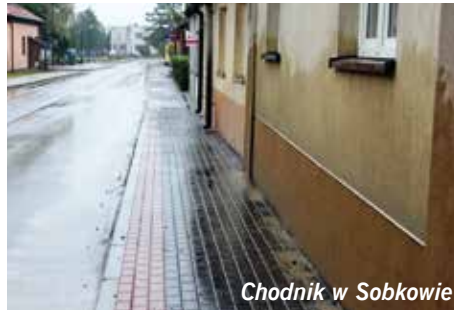
Chodnik w Sobkowie