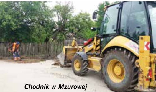
Chodnik w Mzurowej