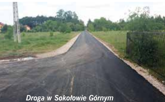
Droga w Sokółowie Górnym