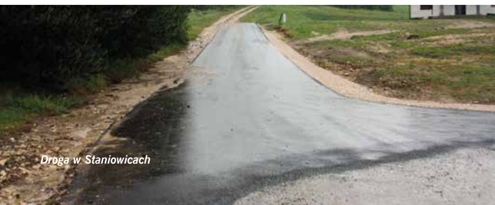
Droga w Staniowicach