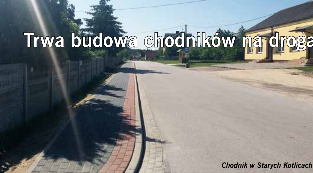
Chodnik w Starych Kotlicach

Po rozstrzygnięciu przetargu przez Zarząd Dróg Powiatowych w Jędrzejowie, wykonawcy realizują budowę chodników na następujących drogach powiatowych na terenie gminy Sobków: