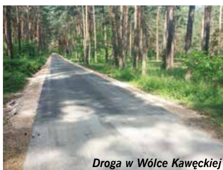
Droga w Wólce Kawęckiej