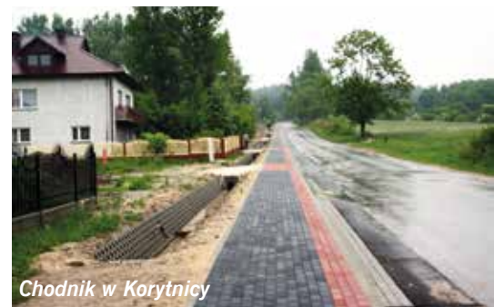
Chodnik w Korytnicy