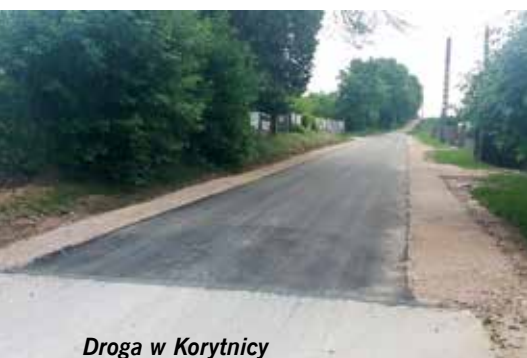
Droga w Korytnicy