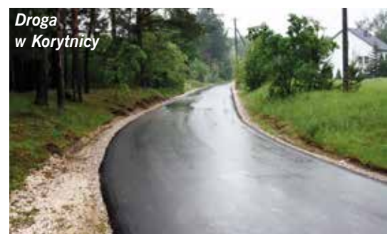
Droga w Korytnicy