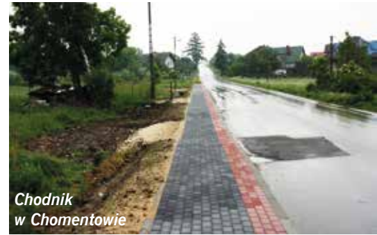
Chodnik w Chomentowie