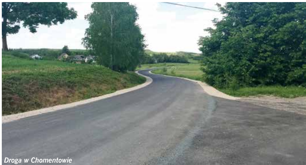
Droga w Chomentowie