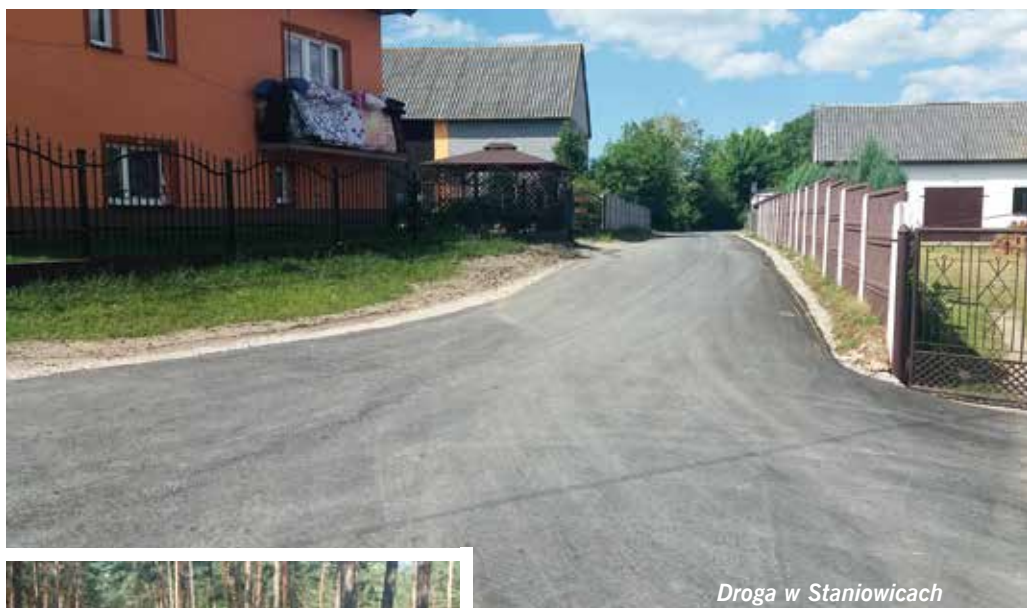
Droga w Staniowicach