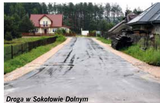
Droga w Sokółowie Dolnym