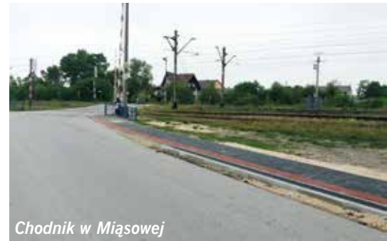
Chodnik w Miąsowej