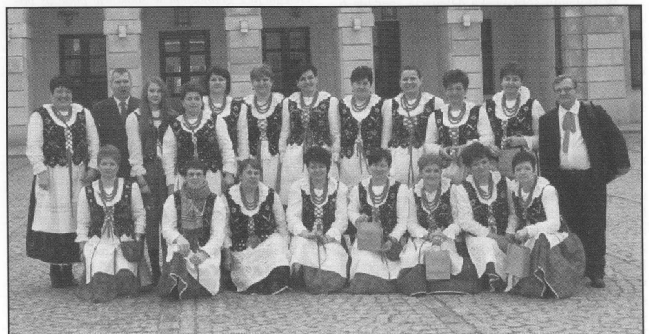
Delegacja KGW z Korytnicy w Warszawie.

Na zakończenie wizyty przygotowany został uroczysty poczęstunek.