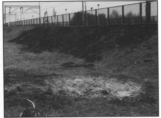
Wypalanie traw, przy torach kolejowych w Sobkowie, jest niebezpieczne także dla ludzi.

W wyborze laureatów wojewodzie pomoże Komitet Honorowy. Po konsultacji z komitetem, wojewoda dokona ostatecznego wyboru laureatów nagrody. Gala finałowa „Lauru Świątokrzyskiego” odbędzie się 24 kwietnia w Centrum Konferencyjnym Targów Kielce.