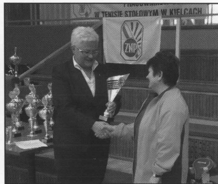
Puchar dla zwyciężczyni.