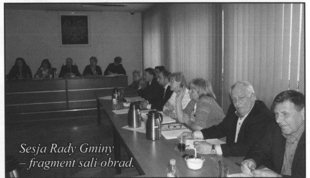
Sesja Rady Gminy – fragment sali obrad.