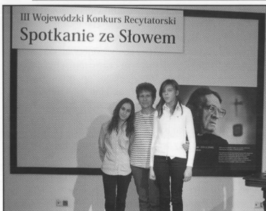
Wyróżnione uczennice wraz ze swoją nauczycielką.

„Spotkanie ze słowem” to żywy kontakt z poezją i prozą polską. Tegoroczna edycja prezentowała wysoki poziom artystyczny recytatorów, a jury miało niełatwe zadanie, by wyłonić najlepszych.