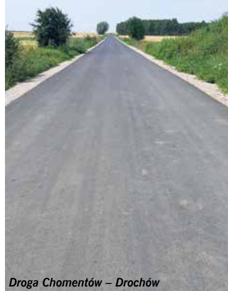
Droga Chomentów – Drochów

Łącznie w ramach programu usuwania skutków klęsk żywiołowych zostanie wybudowane ponad 4,5 km dróg za całkowitą kwotą wynoszącą niemal 1,5 miliona złotych. Dofinansowanie zewnętrzne wyniesie około 80% a środki własne to blisko 20%. Na podstawie podpisanych w maju umów koniec prac nastąpi 15 sierpnia. Ponadto w związku z licznymi opadami, jakie wystąpiły wiosną, powodując zniszczenie kolejnych nawierzchni Gmina Sobków złożyła wnioski o dofinansowanie remontów następujących 14 odcinków dróg. Obecnie czekamy na rozstrzygnięcie dotyczące przyznania promes.