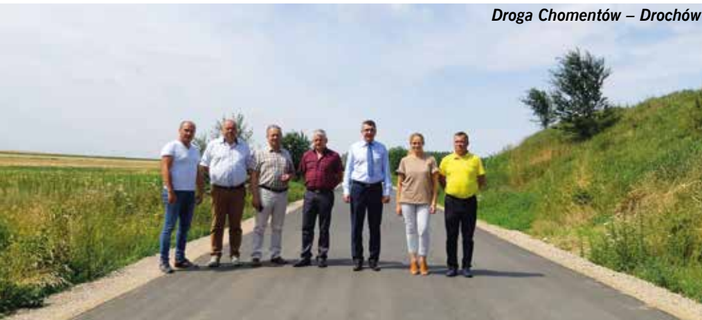
Droga Chomentów – Drochów