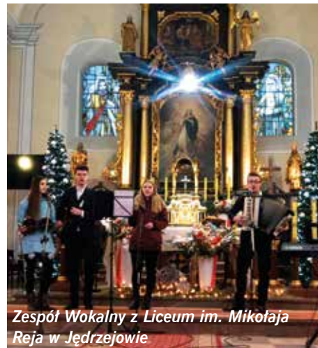
Zespół Wokalny z Liceum im. Mikołaja Reja w Jędrzejowie