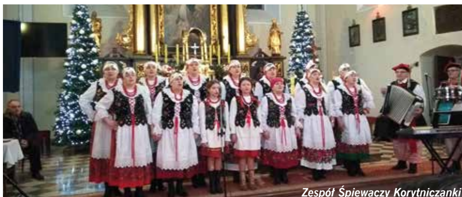
Zespół Śpiewaczy Korytniczanki