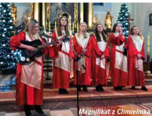
Magnificat z Chmielnika