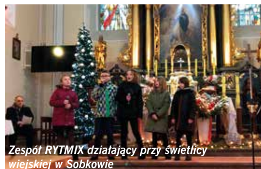
Zespół RYTMIX działający przy świetlicy wiejskiej w Sobkowie

Tegoroczny Przegląd Kolęd i Pastoralek należy uznać za bardzo udany, jego uczestnicy wyrazili chęć ponownego spotkania w następnym roku.