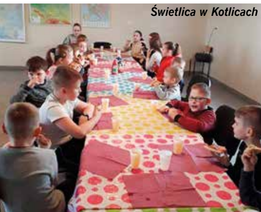
Świetlica w Kotlicach