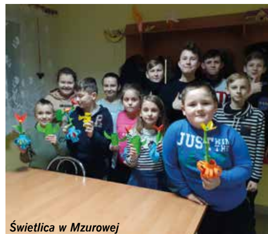
Świetlica w Mzurowej