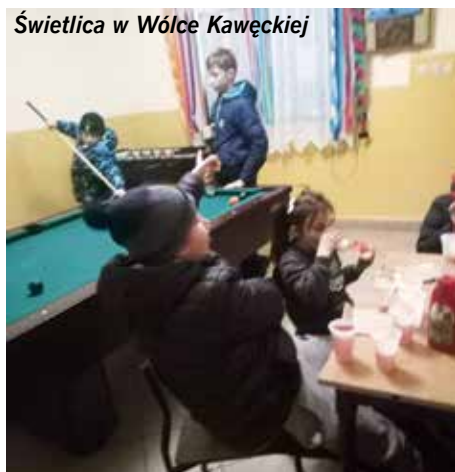
Świetlica w Wólce Kawęckiej