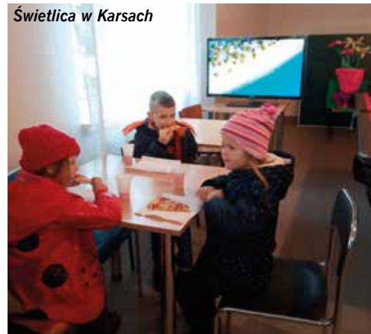
Świetlica w Karsach

na grillu przy współpracy z radnymi, sołtysami oraz radą sołecką z niektórych miejscowości, a na zakończenie ferii dla wszystkich dzieci, które uczęszczały na zajęcia został organizo-