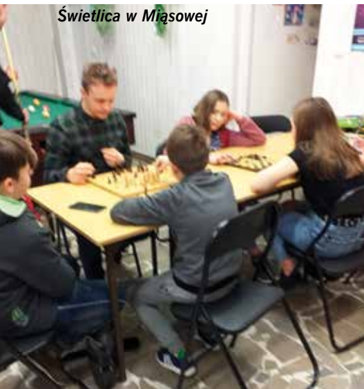
Świetlica w Miąsowej