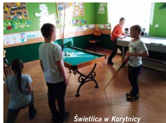
Świetlica w Korytnicy