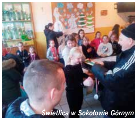
Świetlica w Sokołowie Górnym