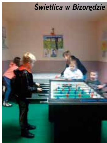
Świetlica w Bizorzędzie

Pomimo iż zimowe ferie szybko minęły a obowiązki szkolne powróciły i zajmują najmłodszym mieszkańcom naszej gminy większość wolnego czasu, miłe chwile spędzone w trakcie ferii warto zatrzymać na dłużej. Aby czas ferii nieco urozmaicić, zgodnie z zaplanowanym przez pracownice świetlic wiejskich harmonogramem pracy w 16 miejscowościach naszej gminy, w których znajdują się świetlice, zorganizowano szereg zajęć.