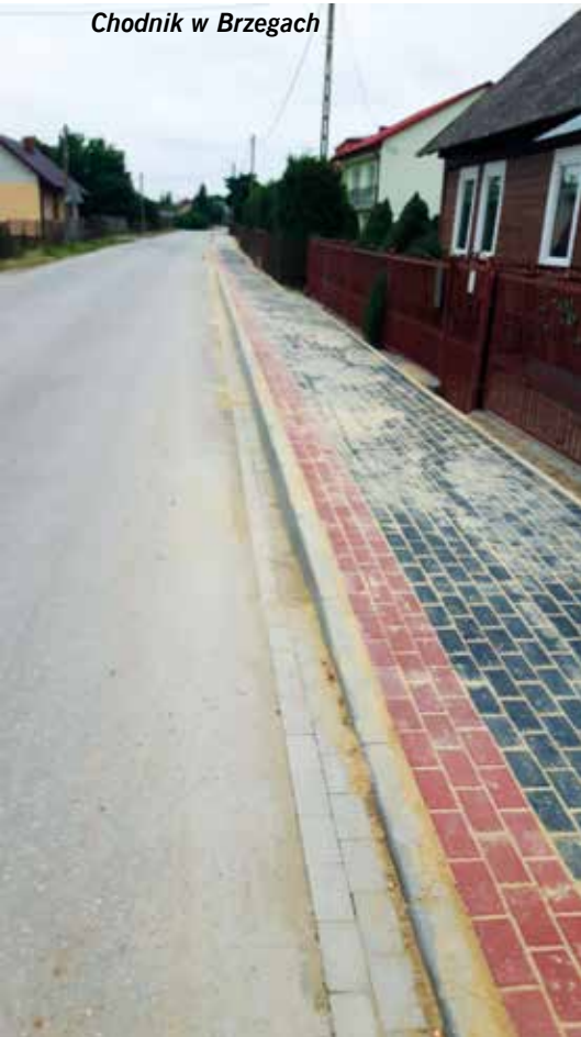
Chodnik w Brzegach