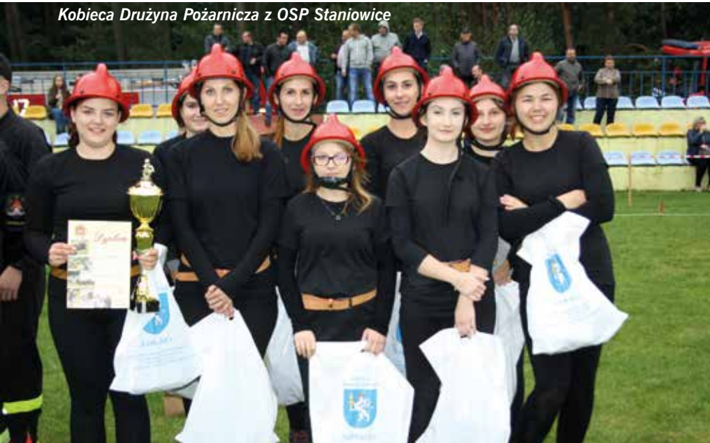
Kobięca Drużyna Pożarnicza z OSP Stanowice

Zwycięskie drużyny – MDP i KDP OSP Sokotów Górny – będą reprezentowały powiat jędrzejowski podczas zawodów na szczeblu wojewódzkim, które rozegrane zostaną w przyszłym roku.