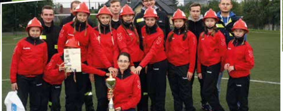
Kobięca Drużyna Pożarnicza OSP Sokotów Górny

W klasyfikacji końcowej w kategorii Kobiecych Drużyn Pożarniczych, drużyna OSP Sokotów Górny obroniła tytuł zwycięzcy i zajęła I miejsce, natomiast Kobięca Drużyna Pożarnicza ze Stanowic uplasowała się na II miejscu. W kategorii męskich drużyn Ochot-