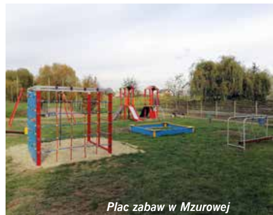
Plac zabaw w Mzurowej

– gdzie postawiono także ogrodzenie panełowe – oraz w Sokotowie Dolnym. Wykonano również boisko w Szczepanowie, ogrodzono je piłkochwyłtami, a w trakcie realizacji są także doposażenia placów zabaw w Brzeźnie i Sobkowie. Ponadto przeprowadzono remonty remiz OSP i świetlic wiejskich w miejscowościach: Bizoręda, gdzie wykonano przebudowę istniejącego pomieszczenia gospodarczego na łazienkę i wykonano bezodpływowy zbiornik na ścieki. Wcześniej na wspomniane zadania wykonano dokumentację projektową za 8000,00 zł. Ponadto pracownicy z Urzędu Gminy pomalowali ściany zewnętrzne remizy w Bizorędzie.