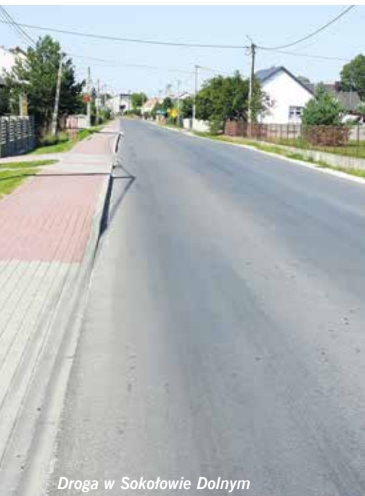
Droga w Sokółowie Dolnym

W Mokrsku Dolnym przeprowadzono generalny remont budynku OSP za kwotę 45 000 zł, a w Jaworze za 25 000 zł. Przeprowadzono również szereg remontów, wśród których warto wyróżnić: wymianę pokryć dachowych w Sokołowie Górnym za kwotę 94 261,54 zł oraz w Korytnicy za kwotę 124 500 zł, wykonano elewację budynku OSP Brzezi za 21 771,52 zł, w Brzeźnie za 20 000 zł, wyremontowano budynek wiejski w Lipie za 8890 zł, a w Nizinach, Żernikach i wspomnianej Lipie wybudowano drewniane altany z meblami ogrodowymi za łączną kwotę 29 698 zł gdzie wcześniej wykonano podbudowę z kostki betonowej za łączną kwotę 17 342 zł. Dodatkowo w Nizinach niebawem zostanie wykonany mostek przy