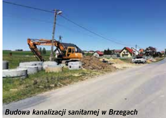
Budowa kanalizacji sanitarnej w Brzegach

We wrześniu 2020 r. zostało zakończonych i oddanych do użytkowania 13 odcinków dróg gminnych i wewnętrznych o nawierzchni asfaltowej w tym: przebudowa drogi wewnętrznej o dt. 105 mb wraz z rozjazdem dt. 52 mb w m. Korytnica, przebudowa drogi wewnętrznej o dt. 40 mb w m. Staniowice (kontynuacja robót z 2019 r. od istniejącej nawierzchni asfaltowej), przebudowa drogi wewnętrznej o dt. 70 mb w m. Staniowice, przebudowa drogi wewnętrznej o dt. 75 mb w m. Żerniki, przebudowa dro-