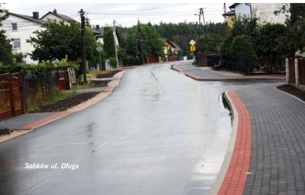
Sobków ul. Długa

stawie na placu wiejskim, a w trakcie realizacji jest również budowa kostki na placu wiejskim w Wierzbicy za kwotę 30 000 zł. Inne inwestycje wymagają stworzenia dokumentacji projektowej. Takowe wykonano dla zadania przebudowy budynku w Staniowicach za 16 000 zł, a umowę za 48 880 zł podpisano również dla dużego projektu przygotowania dokumentacji projektowej i kosztorysowej na wykonanie przedszkola w Miąsowej.