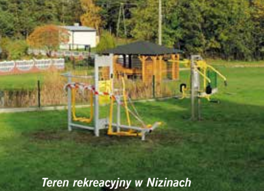
Teren rekreacyjny w Nizinach

W Mokrsku Dolnym przeprowadzono generalny remont budynku OSP za kwotę 45 000 zł, a w Jaworze za 25 000 zł. Przeprowadzono również szereg remontów, wśród których warto wyróżnić: wymianę pokryć dachowych w Sokołowie Górnym za kwotę 94 261,54 zł oraz w Korytnicy za kwotę 124 500 zł, wykonano elewację budynku OSP Brzezi za 21 771,52 zł, w Brzeźnie za 20 000 zł, wyremontowano budynek wiejski w Lipie za 8890 zł, a w Nizinach, Żernikach i wspomnianej Lipie wybudowano drewniane altany z meblami ogrodowymi za łączną kwotę 29 698 zł gdzie wcześniej wykonano podbudowę z kostki betonowej za łączną kwotę 17 342 zł. Dodatkowo w Nizinach niebawem zostanie wykonany mostek przy