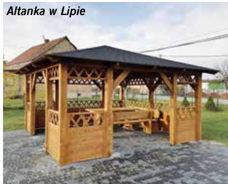
Altanka w Lipie

zabaw i siłownie plenerowe wyrastające jak grzyby po deszczu na gminnych działkach w niemal każdej miejscowości. Sukcesywne ich doposażenie sprawia, że miejsca te tętnią życiem, czyli nie tylko sprawiają radość najmłodszym, ale również integrują i zrzeszają. Ponadto przez nasz samorząd realizowane są duże, dofinansowane ze środków zewnętrznych inwestycje. Przechodząc do konkretów, warto wspomnieć, że tylko w tym roku wybudowano lub doposażono place w Szczepanowie, Korytnicy, Starych i Nowych Kotlicach, Mzurowej, Nizinach, Osowej