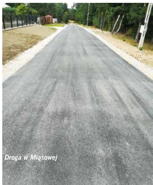
Droga w Miąsowej

Łączna długość wykonanych odcinków dróg o nawierzchni asfaltowej wyniosła 1217 mb. Całkowity koszt budowy to 442 493 zł. Źródłem finansowania były środki własne z budżetu gminy Sobków, przy czym drogi w m. Chomentów, Staniowice, Żerniki/Choiny