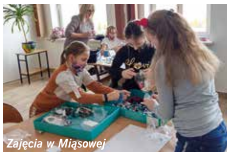
Zajęcia w Miąsowej

W ramach projektu zakupiono sprzęt TIK i pomoce dydaktyczne stanowiące wyposażenie sal lekcyjnych w trzech placówkach tj. w Szkole Podstawowej w Miąsowej, w Szkole Podstawowej w Zespole Placówek Oświatowych w Brzegach oraz Szkole Podstawo-