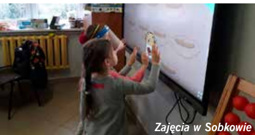
Zajęcia w Sobkowie