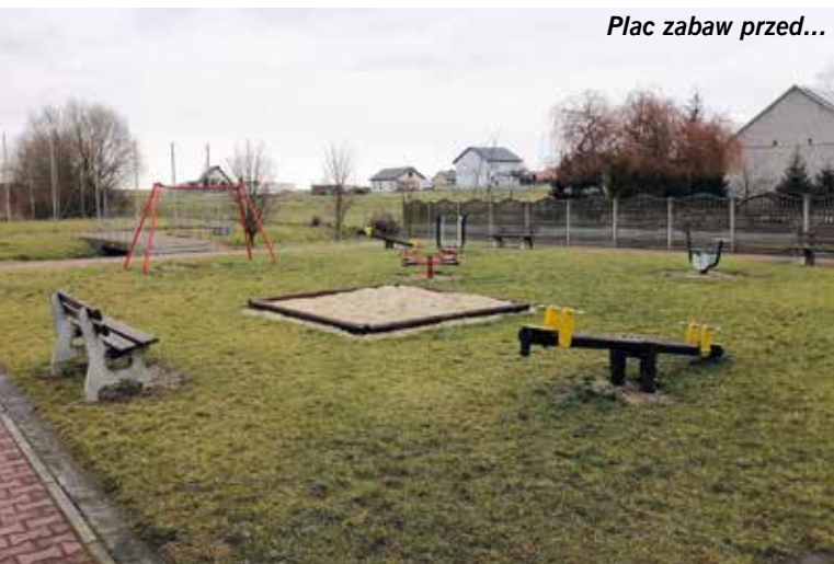
Plac zabaw przed...