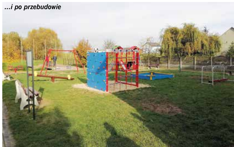
...i po przebudowie

Pod koniec października bieżącego roku został odebrany nowy, rozbudowany plac zabaw w miejscowości Mzurowa.