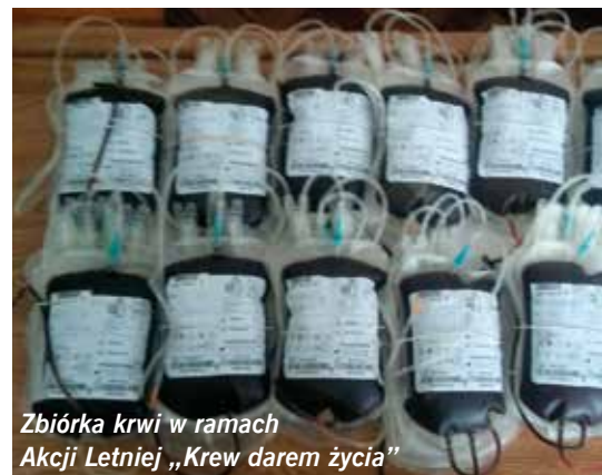
Zbiórka krwi w ramach Akcji Letniej „Krew darem życia”

Rok 2019 obfitował w liczne inwestycje realizowane na terenie gminy, a pozyskiwanie środków z zewnętrznych źródeł finansowania stało się działaniem priorytetowym. Dzięki podjętym decyzjom naszych mieszkańców zostało zrealizowanych wiele inwestycji w ramach funduszu sołeckiego. Składane wnioski w większości dotyczyły poprawy warunków życia, wypoczynku, rekreacji czy infrastruktury. Naszym celem było spełnienie tych oczekiwań, a przede wszystkim zwiększenie komfortu życia wszystkich mieszkańców na-