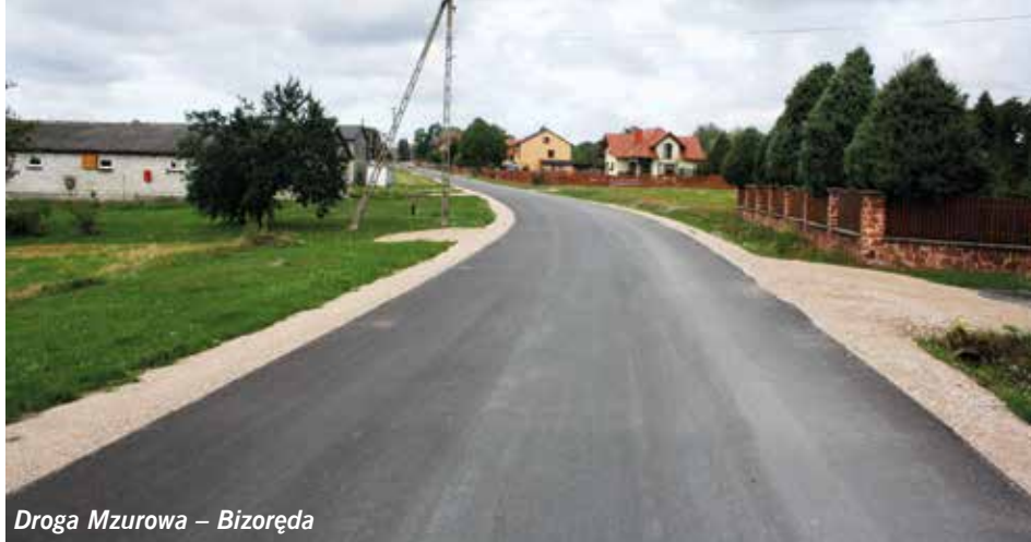
Droga Mzurowa – Bizoređa

kwotę wynoszącą 2 934 918,27 złotych. Dofinansowanie zewnętrzne wyniosło około 80%, a środki własne to blisko 20%. Ponadto w związku z wystąpieniem deszczów nawalnych w miesiącach maj i sierpień 2019 r., Gmina Sobków złożyła protokoły do zatwierdzenia z szacowania strat na 39 odcinków dróg. Po przeprowadzeniu przez Świętokrzyski Urząd Wojewódzki w Kielcach wizji w terenie, do ww. programu zakwalifikowano 34 odcinki dróg. Z chwilą otrzymania promes zostanie wdrożona procedura ich wykonania.